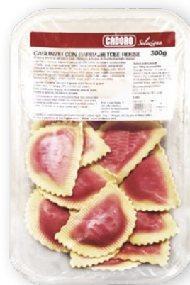
Casunzei alle Rape Rosse 300 gr (al kg € 11,97) €4,79 -25%