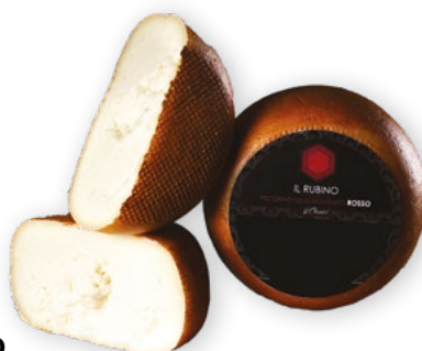
Pecorino Rosso Semistagionato €21,90 -20%