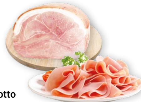
Prosciutto Cotto €12,90 -15%