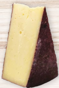
Formaggio Stagionato Ubrico €19,90 -20%