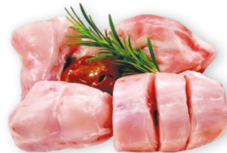
✳ Coniglio porzionato