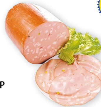
Mortadella di Bologna IGP €12,90 -23%