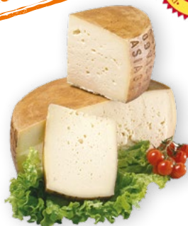
Asiago Pressato DOP di Montagna stagionato 50 giorni €14,90 -20%