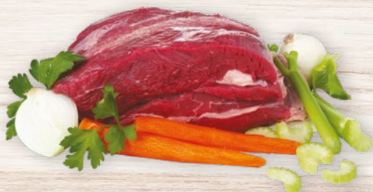
✳ Bollito Misto di Sorana