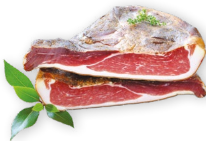
Speck Montagna €18,90 -15%